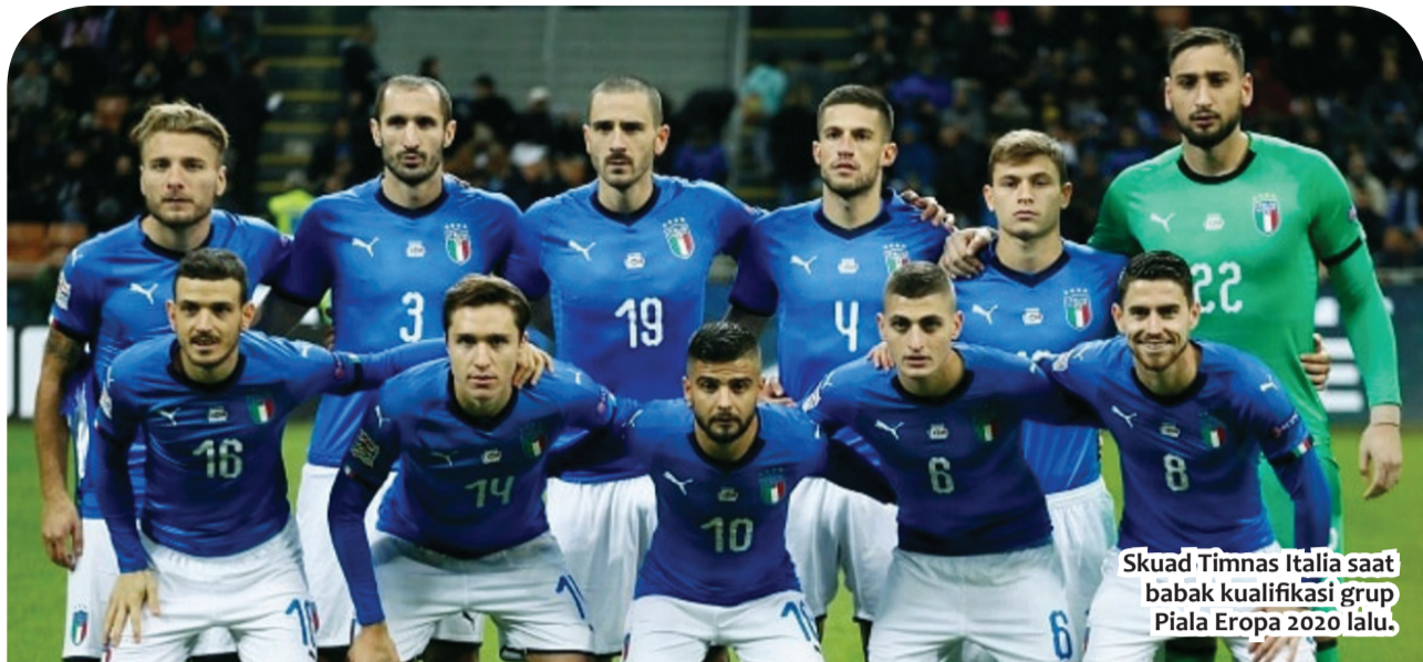
Skuad Timnas Italia saat babak kualifikasi grup Piala Eropa 2020 lalu.

“Kami telah menempatkan mentalitas yang berbeda. Semuanya lebih mudah, berjalan baik dan kami yakin bisa memainkan sepakbola yang bagus,” kata Roberto Mancini.